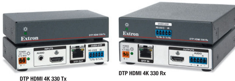
DTP HDMI 4K 330 Tx