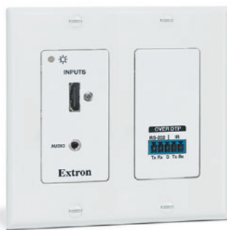
DTP HDMI 4K 230 D Tx