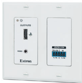
DTP HDMI 4K 230 D Rx

Extron DTP HDMI 4K 230 D 是一款 Decora® 型延长器，可通过单根 CATx 屏蔽电缆将 HDMI、模拟音频和双向控制信号传送至 70 m (230') 远的距离。这款符合 HDCP 标准的延长器采用便利的规格尺寸，能够提供最大的安装灵活性。