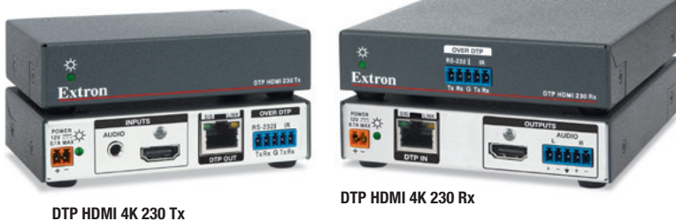
DTP HDMI 4K 230 Tx