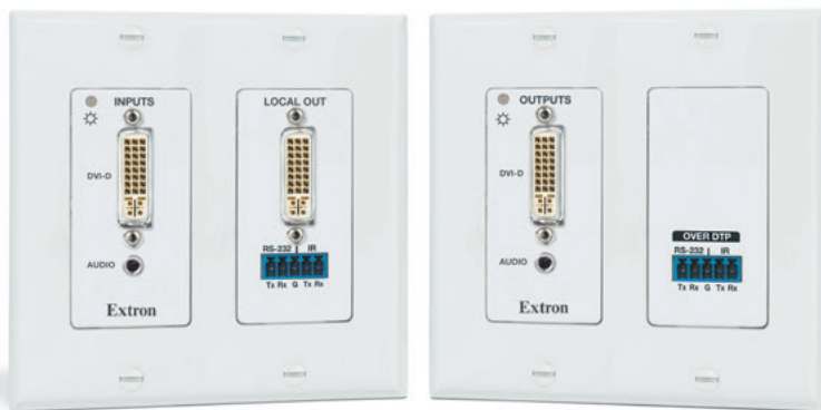
DTP DVI 4K 230 D Tx