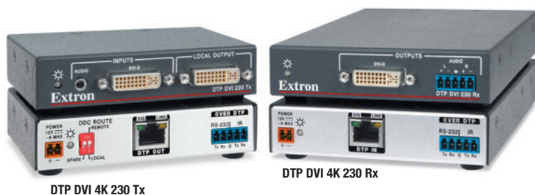
DTP DVI 4K 230 Tx