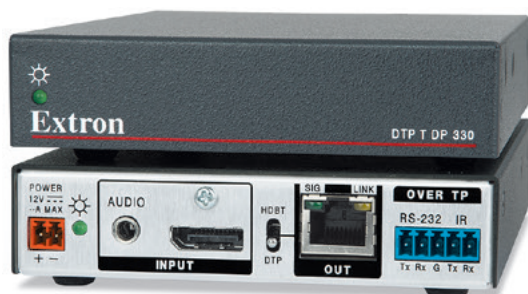
DTP T DP 4K 330