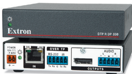
DTP R DP 4K 330

Extron DTP DP 4K 330 延长器可通过单根 CATx 屏蔽电缆将 DisplayPort、模拟音频和双向控制信号传送到 100 m (330') 远的距离。这款符合 HDCP 标准的紧凑型延长器，能隐蔽地安装在多种应用环境中。